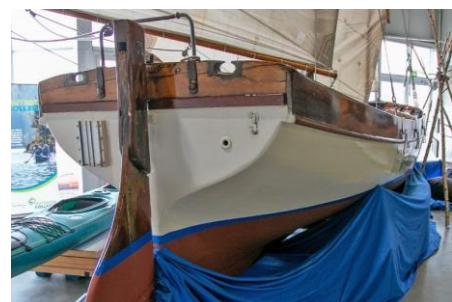
Wasser unter'm Kiel – Wind im Gesicht – draußen unterwegs