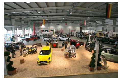
Mehr PS? Offroad und Outdoor unterwegs – gemacht für Entdeckungen