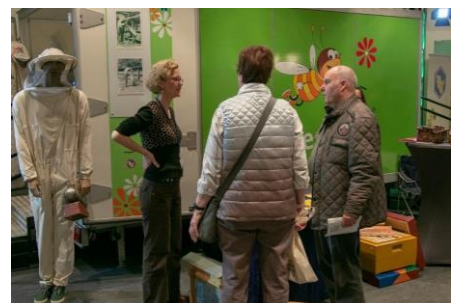
Informationen und Ideen zu Biodiversität, zu Biotopen und ihren Bewohnern