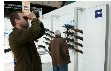
Alle Neuigkeiten aus dem Bereich Waffen und Optiken