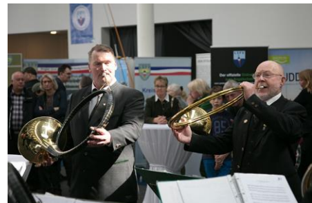
Tradition und Moderne – Jagd und Fischerei – Beruf und Berufung

Holstenhallen Neumünster GmbH Messeleitung OUTDOOR Justus-von-Liebig-Straße 2 – 4 · 24537 Neumünster Tel: 04321-910 190 · Fax: 04321-910 199 E-mail: outdoor-messe@holstenhallen.com Internet: http://www.outdoor-holstenhallen.com