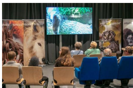
Mehr sehen! Atemberaubende Bilder, neue Perspektiven, fremde Welten!