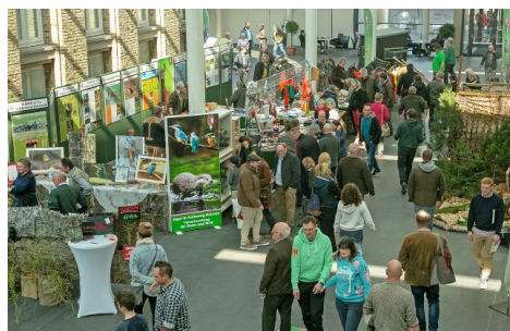
Was gibt's Neues in Feld und Flur?