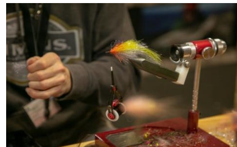
Perfekte Fliegen binden – Kunst und Können!

In der Natur bewegen sich Angler hauptsächlich am, im oder auf dem Wasser. In der Halle 5 dagegen können Interessierte nicht nur beim Casting des Landessportfischerverbandes Schleswig-Holsteins zuschauen, sondern selbst aktiv werden und mit der Angelrute unter kompetenter Anleitung gezielt Wurfgewichte auf Scheiben werfen. Außerdem können Besucher sich auch hier über Artenschutzprojekte,