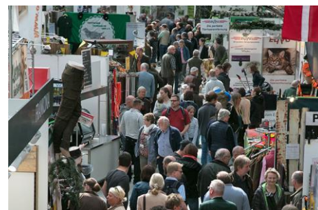
Profi-Ausrüstung für die Arbeitswelt und private Abenteurer