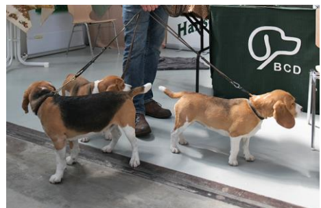
Schönes und Nützliches für den ausgebildeten Hund - und alle anderen.