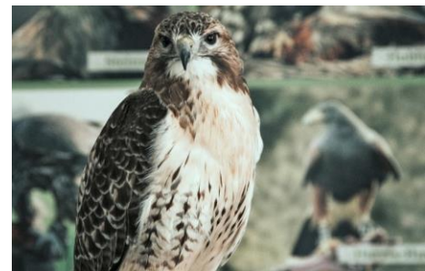
Greifvögel ganz nah – Falkner stellen ihre majestätischen Kollegen vor

In diesem Jahr präsentiert die „OUTDOOR 2020 jagd & natur“ in der Halle 4 das Sonderthema Wald! Schließlich bedecken Wälder rund ein Drittel der weltweiten Landoberfläche, und um den Wald müssen wir uns kümmern: Allein in den letzten 20 Jahren wurden durchschnittlich 13 Millionen Hektar Waldfläche jährlich vernichtet. Dabei bietet gerade der Wald einen artenreichen und vielfältigen Lebensraum, der vielen Pflanzen und Tierarten als Heimat dient.