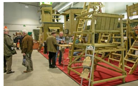
Jagdeinrichtungen in überzeugender Qualität und besonderer Ausführung