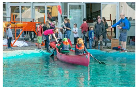
Die Welt zukünftig vom Wasser aus entdecken? Einfach mal probieren!