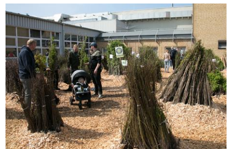
Heimische Bäume und Gehölze werden gegen Spende abgegeben – Helfen Sie mit, pflanzen Sie Lebensraum!